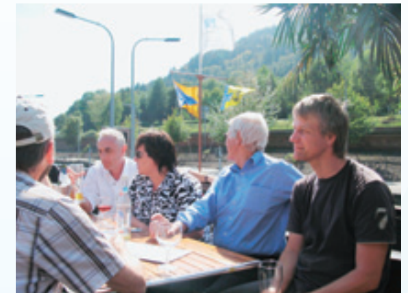
遊覧船の船上の場面