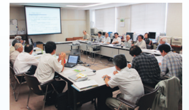
図3 総研大基盤機関のアーカイブ室合同会合の様子(2012年7月17日) 参加機関:総合研究大学院大学、高エネルギー加速器研究機構、分子科学研究所、国立天文台、生理学研究所、基礎生物学研究所、国立極地研究所、国立遺伝学研究所、核融合科学研究所