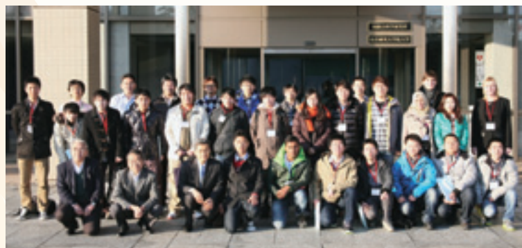
参加者による集合写真

3日目には、周辺プラズマ、材料のシミュレーションおよび電磁場計測に関する講義、大型ヘリカル装置(LHD)の見学、バーチャルリアリティ(VR)装置ComplexCopeでの3次元仮想空間体験が行われました。LHD見学では実際の大型装置とともに過去に作られた装置なども見学し、VRでは、参加者一人一人が実際に装置を操作してVR空間を移動しながらシミュレーションデータの解析を行う