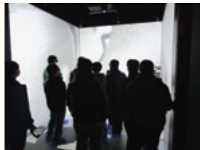
バーチャルリアリティ装置ComplexCopeでの3次元仮想空間体験