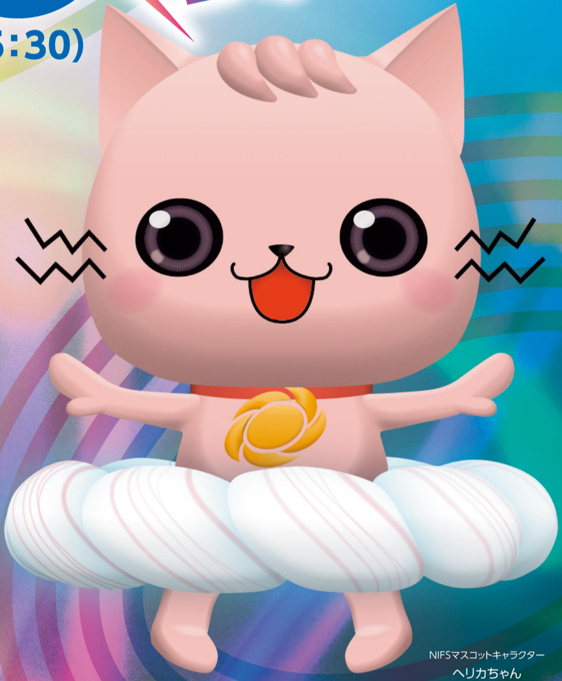
NIFSマスコットキャラクター ヘリカちゃん