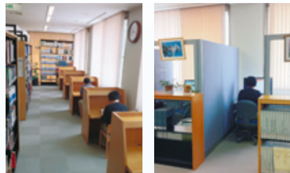
写真2: (左)キャレルデスク(個人用閲覧机)、(右)研究個室。

図書や雑誌はすべて開架式ですので、読みたい資料を見つけたら手にとって利用できますし、図書室内では、キャレルデスク(個人用閲覧机)、研究個室、大テーブル等を使って閲覧いただけます(写真2)。電子ジャーナルや電子ブックについても、研究個室、カウンターの端末でご自由に閲覧できます。また、視聴覚個室も備えてあり、DVD等が視聴できます。DVDは専門的内容のものから、アニメ作品までいろいろ揃えてあり