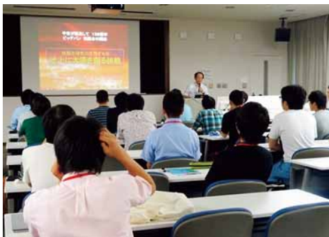
竹入専攻長による特別講義の様子

国立大学法人 総合研究大学院大学（総研大）物理科学研究科核融合科学専攻では、大学院への進学を検討されている方々にプラズマ理工学及び核融合工学に関連した最先端の研究を体験していただくことを目的として、令和元年8月26日から30日にかけて夏の体験入学を開催します。核融合プラズマの閉じ込め・加熱・計測に関わる実験及び理論的研究、プラズマ・シミュレーション研究、核融合炉設計・応用研究のための工学的研究等、10課題を超える幅広い分野から興味のある課題を選択し、教員や総研大在学生の指導に沿って、少人数グループによる5日間の宿泊形式で、核融合研究の最前線を体験していただきます。