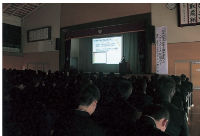
大館鳳鳴高校における「ふるさと訪問授業」の様子