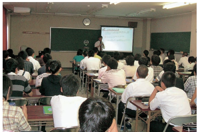
津西高校における「ようこそ先輩」講演会の様子