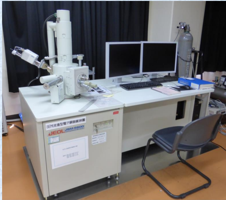
実習で使用する走査型電子顕微鏡 (日本電子製JEOL-5500)

電子顕微鏡では、加速した電子線を用いることで、高い倍率で観測ができるだけでなく、元素の分析も行うことができます。500円玉・1€コインを、電子顕微鏡で観察してみましょう。