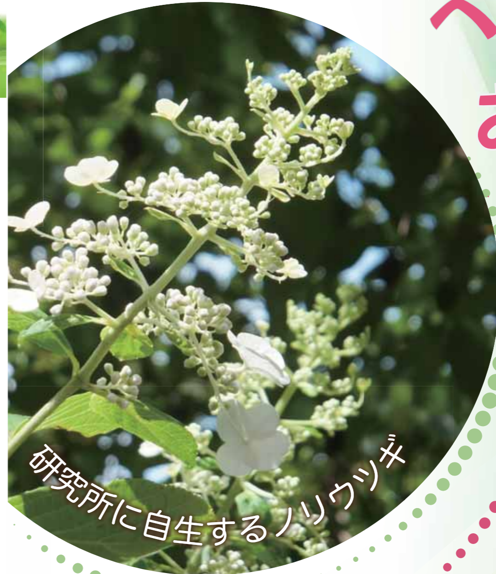
研究所に自生するノリウツギ

新型コロナウイルス感染症対策の状況により、中止になる場合がございますので、その時の感染状況を考慮して、お出かけの際は、ホームページでご確認、または下記お問い合わせ先へご連絡願います。