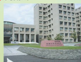
門衛所から見た正面玄関